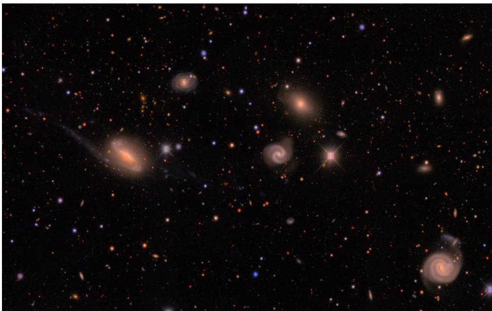
Imagen de DECam de un campo en la constelación austral de Lepus que muestra estrellas de la Vía Láctea (pequeños puntos de colores) y un grupo de galaxias (los objetos difusos de mayor tamaño) situado a unos 300 millones de años luz. La imagen corresponde a una pequeña fracción de una de las observaciones realizadas con la Dark Energy Camera. El análisis del DES mide las galaxias más débiles visibles en esta imagen.